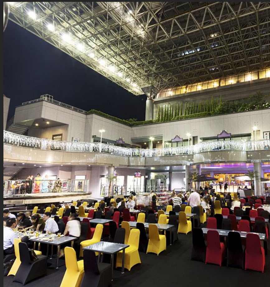
全天候型 空間広場