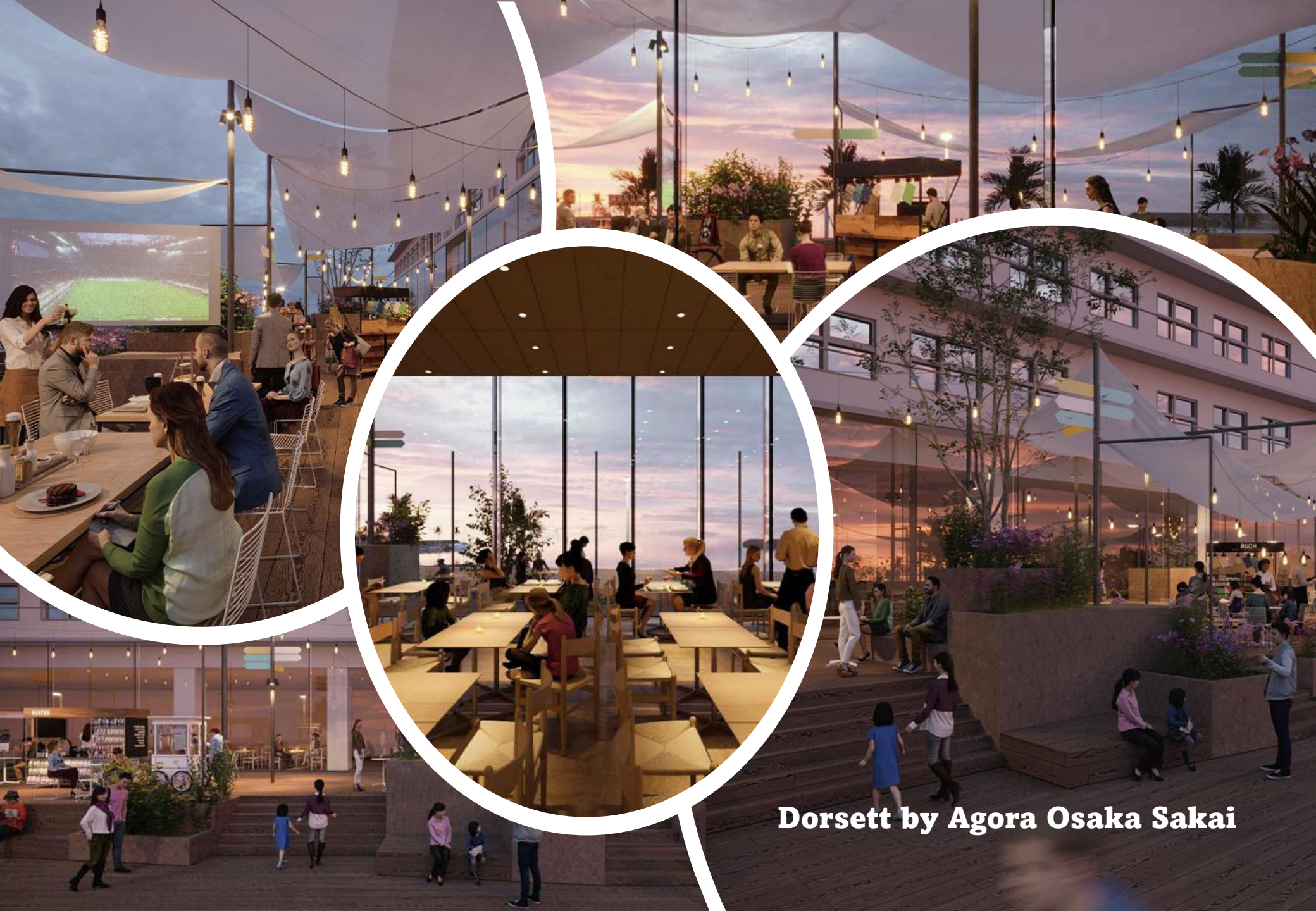
Dorsett by Agora Osaka Sakai